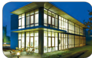
Bürogebäude Diétel Bauelemente GmbH (D)