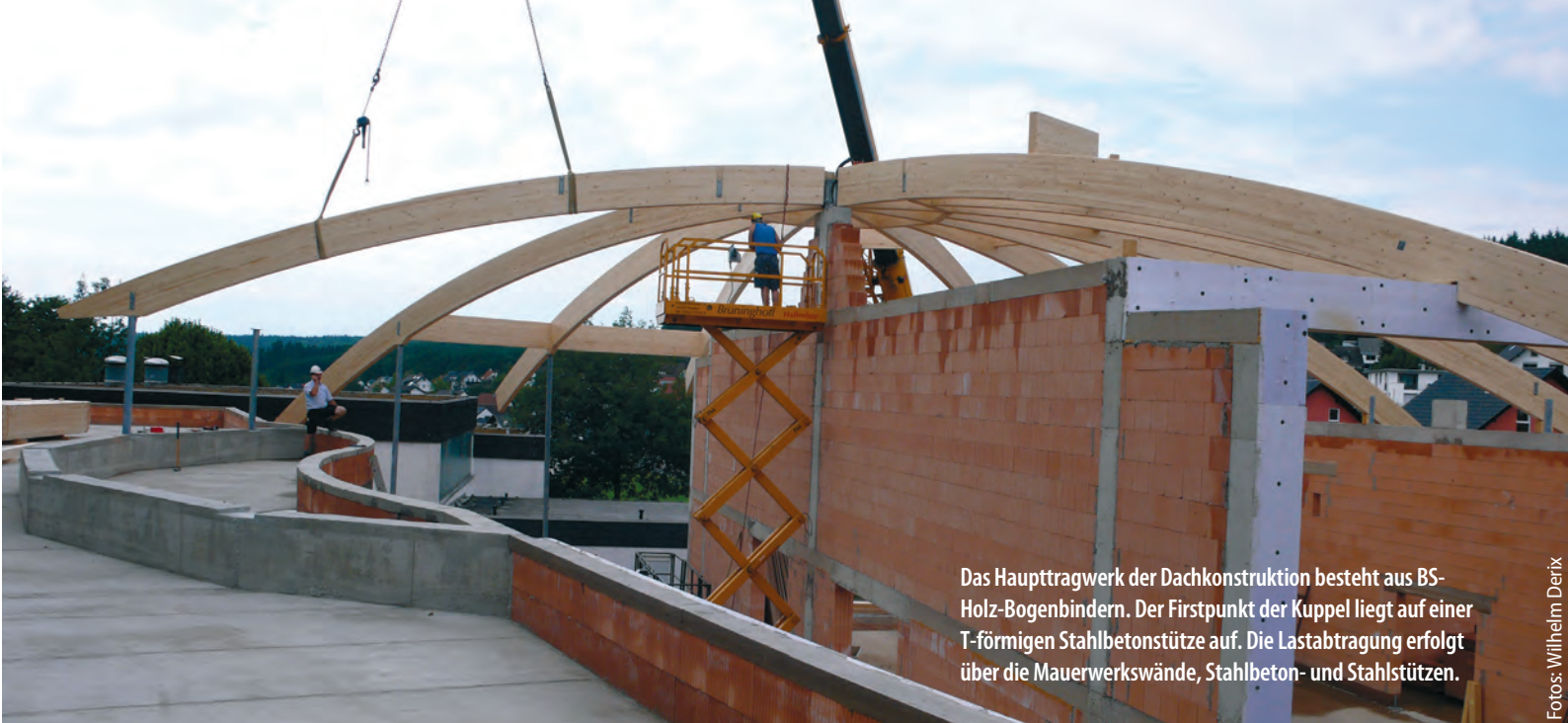
Das Haupttragwerk der Dachkonstruktion besteht aus BS-Holz-Bogenbindern. Der Firstpunkt der Kuppel liegt auf einer T-förmigen Stahlbetonstütze auf. Die Lastabtragung erfolgt über die Mauerwerkswände, Stahlbeton- und Stahlstützen.