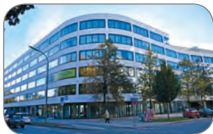
Bürokomplex „Sunyard“ Lindner Group (D)