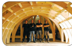
Kircheansanierung Chapelle de la Puret  (F)