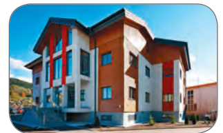
Bürogebäude StoraEnso (A)

Dieser Folder steht im ausschließlichen Eigentum der Knapp GmbH. Vervielfältigungen, Reproduktion oder Veröffentlichungen, auch nur auszugsweise, sind nur nach vorheriger schriftlicher Genehmigung durch die Knapp GmbH gestattet. Alle Angaben in diesem Folder erfolgen unter dem Vorbehalt etwaiger Druck- und Schreibfehler sowie sonstiger Irrtümer. Technische Zeichnungen und Berechnungen, insbesondere solche, die die Statik betreffen, sind vom Kunden in Eigenverantwortung vorzunehmen. Allfällige diesbezügliche Berechnungen und Zeichnungen seitens der Firma Knapp GmbH sind Vorschläge zur Orientierung ohne Gewähr und/oder Haftung für deren Richtigkeit und befreien den Kunden daher nicht davon, selbst für eine ordnungsgemäße Zeichnung und Berechnung durch einen Fachmann Sorge zu tragen. Bildnachweise liegen vor und können bei Bedarf angefordert werden. Alle Rechte vorbehalten. Copyright © 2013 by Knapp GmbH